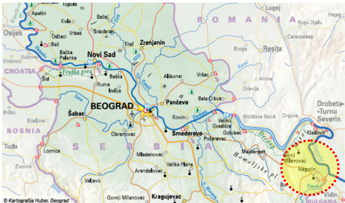
Slika 1: Područje reke Dunav

Reka Dunav izaziva značajne poplave u ovom području, što posebno pogađa opštinu Radujevac.